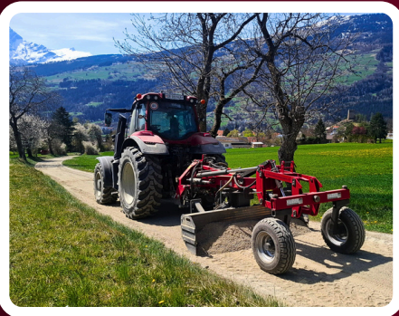
Planie erstellen mittels Planierschild