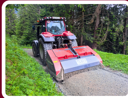
Fräsen mit mobilem Steinbrecher