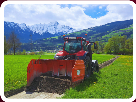
Material ab Wand vorlegen