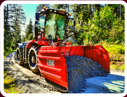
Material ab Wand vorlegen