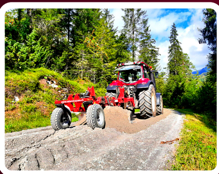
Planie erstellen mittels Planierschild